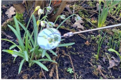
Sneeuwklompstok met spiegeltje.

Nog een waardevolle sneeuwklompstip van Rika: Sneeuwklompjes groeien goed op tomatenmest (en zoals de hovenier in ons gezelschap opmerkte: óók op brandnetelthee!). Hieronder een flink gevulde nieuwsbrief – om na het tuinwerk rustig te lezen met een mok koffie er bij. Geniet van de tuin en het prachtige voorjaarsweer dit weekend!