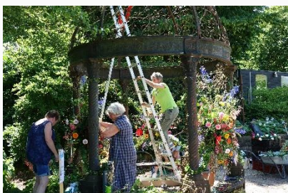
Plantenfestijn Appeltern. Foto: Machteld Oudshoorn.

De derde editie voor het Appeltern Plantenfestijn met Groei & Bloei wordt gehouden op zaterdag 14 en zondag 15 juni. Met dit jaar extra aandacht voor de 'Slow Flowers': seizoensgebonden bloemen, lokaal geteeld in de volle grond, met respect voor en in samenwerking met de natuur. Slow Flowers zijn niet automatisch biologische of biodynamische bloemen, maar kunnen dat wel zijn. Meer informatie volgt op een later tijdstip.