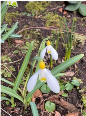
Bijzonder geel sneeuwkllokje.

mee naar de eerste tuin die we bezochten: Tuinfleur. Deze 400 meter lange tuin was opgebouwd uit vele tuinkamers door middel van prachtige door tuineigenaar Pieter gesnoeide beukenhagen. Gastvrouw Rika is galantofiel. Niks ernstigs, ze is gewoon gek van sneeuwkllokjes. En die liefhebberij uit zich in alles: in de tuin die uiteraard vol staat met bloeiende sneeuwkllokjes maar ook met kunstwerken die sneeuwkllokjes uitbeelden. Er is zelfs een sneeuwkllokje naar haar genoemd: Galanthus 'Lovely Rika'