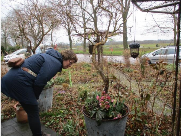
Kijkje bij de leden.