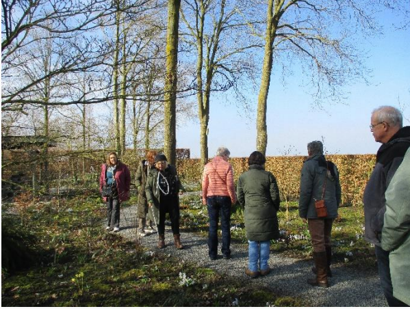
Bij Tuinfleur in Oostwold.

De eerste tuinexcursie van dit jaar was weer heel geslaagd: op dinsdag 4 maart bezocht een groep van twaalf leden maar liefst drie tuinen. Tuinfleur in Oostwold, De vier handen in Vlagtwedde en De Stonefarm in Stadskanaal. Het was prachtig, zonnig weer en dus extra genieten van de vele sneeuwkllokjes, kerstrozen, krokussen en andere voorjaarsbloeiers. Echt verrassend was het cyclamenlaantje bij de Stonefarm.